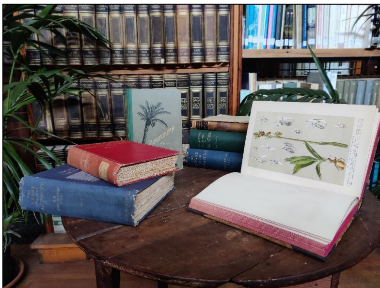
Figura2: Il fondo Bicknell. Volumi di botanica, archeologia, e scienza nella Biblioteca del Museo Bicknell