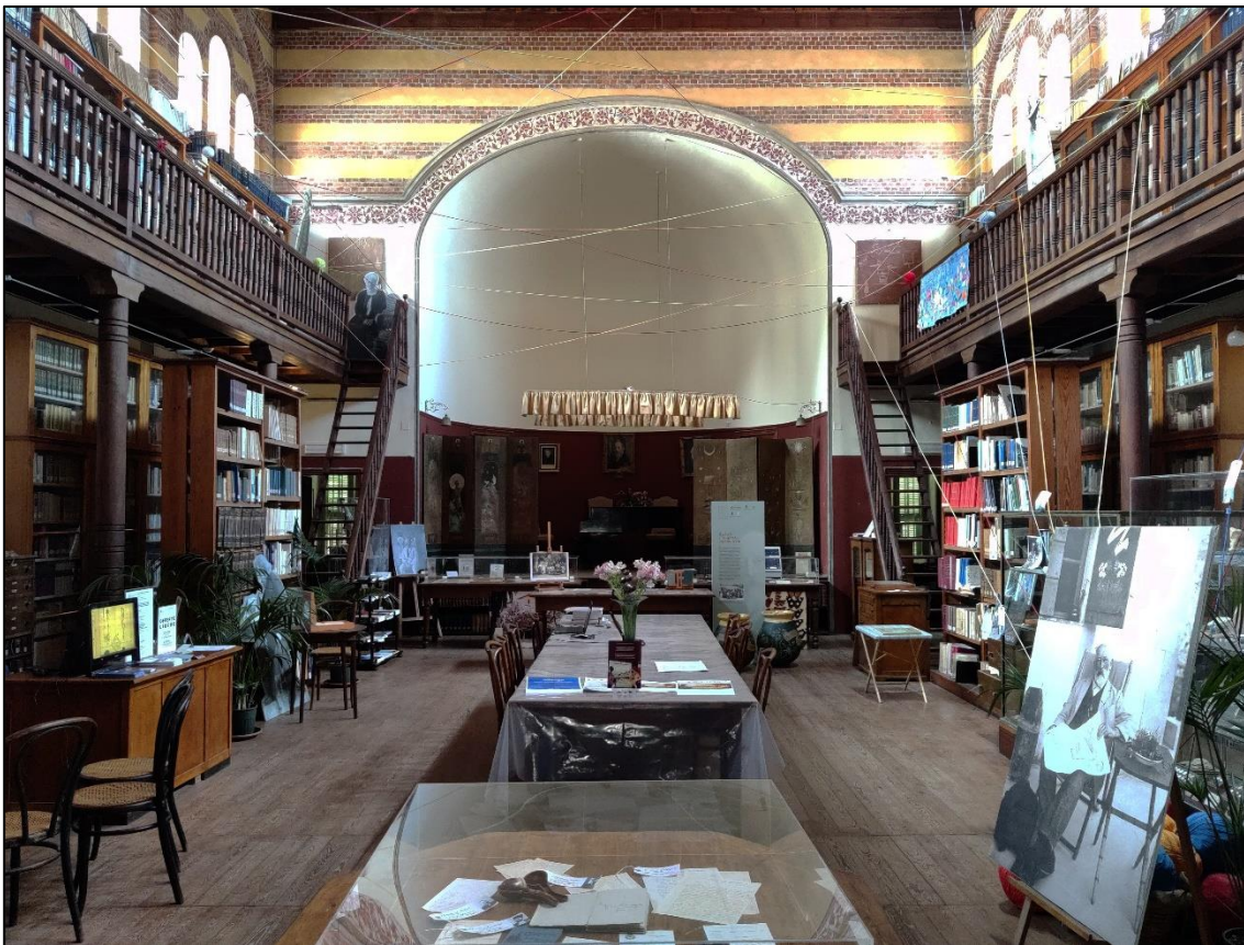
Figura1: Il salone del Museo-Biblioteca Clarence Bicknell oggi.

L'eredità intellettuale e materiale di Clarence Bicknell rinomato botanico, archeologo, esperantista e filantropo del XIX secolo, si riflette a Bordighera nel Museo da lui fondato nel 1888, oggi Museo-Biblioteca "Clarence Bicknell" dell'Istituto internazionale di studi liguri. Gli studenti e i ricercatori che la frequentano possono rimanere sorpresi dall'opportunità di consultare i volumi che un tempo appartenevano a Clarence Bicknell, riconoscibili grazie alle precise etichette di lascito e ai segni di possesso presenti. Questi libri, principalmente testi di saggistica, botanica e archeologia, sono diventati parte del nucleo fondante della collezione della Biblioteca di reference del Museo Bicknell nel decennio successivo alla scomparsa del suo fondatore (17 luglio 1918), affrontando un lungo processo di domiciliazione libraria che si potrà dire concluso solo nel 1937.